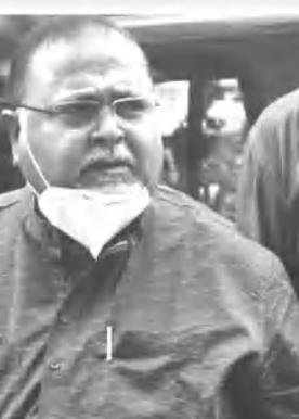
سی بی آئی کے ایک افسر (سی بی آئی کے ایک افسر) نے پارتھا کو تباہ کر دیا گیا۔

کولکاتا: 27 مارچ (عوامی نیوز سروس) سابق وزیر تعلیم پارتھا چٹرجی بھری بدھوئی کے ساتھ ساتھ او ایم آر شیٹ کو تباہ کر دیا گیا۔ سی بی آئی نے پارتھا کو تباہ کر دیا گیا۔ سی بی آئی نے پارتھا کو تباہ کر دیا گیا۔ سی بی آئی نے پارتھا کو تباہ کر دیا گیا۔ سی بی آئی نے پارتھا کو تباہ کر دیا گیا۔ سی بی آئی نے پارتھا کو تباہ کر دیا گیا۔