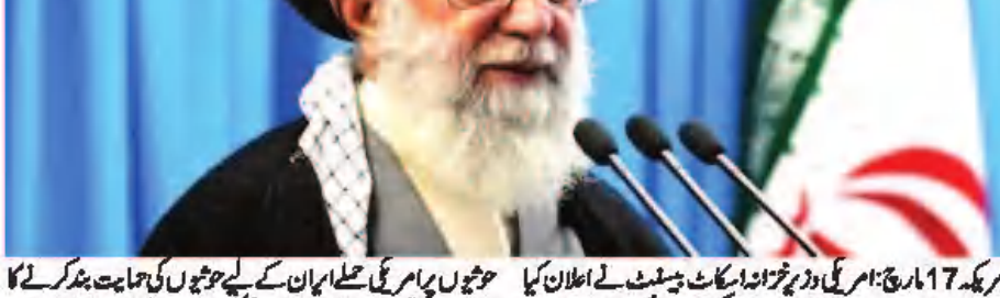
ایران کے رہنما نے امریکہ کی وارننگ کا جواب دیا ہے۔

ایران کے رہنما نے امریکہ کی وارننگ کا جواب دیا ہے۔ انہوں نے کہا کہ ایران امریکہ کی وارننگ کا جواب دے گا۔ انہوں نے کہا کہ ایران امریکہ کی وارننگ کا جواب دے گا۔ انہوں نے کہا کہ ایران امریکہ کی وارننگ کا جواب دے گا۔