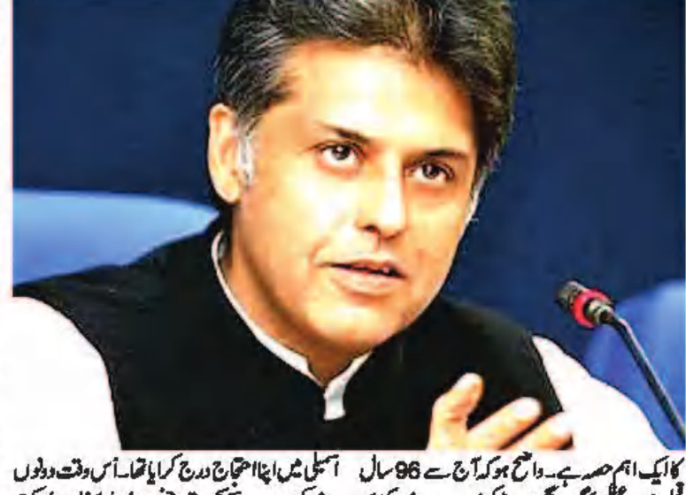
کانگریس رکن پارلیمنٹ منیش تیواری نے ہندوستان کی تاریخ کے بارے میں تحقیقات کا مطالبہ کیا ہے۔

ہندوستان کی تاریخ اور ثقافت کے بارے میں دنیا بھر میں بڑی دلچسپی ہے۔ لیکن ہندوستان کی تاریخ اور ثقافت کے بارے میں دنیا بھر میں بڑی دلچسپی ہے۔ لیکن ہندوستان کی تاریخ اور ثقافت کے بارے میں دنیا بھر میں بڑی دلچسپی ہے۔ لیکن ہندوستان کی تاریخ اور ثقافت کے بارے میں دنیا بھر میں بڑی دلچسپی ہے۔