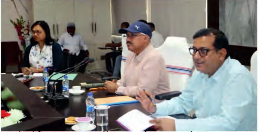
ماہانہ ریونیو جائزہ اجلاس میں ڈی ایچ اے کے ذریعہ متعلقہ افسران کو ہدایت دی گئی۔

جاڑہ لیا گیا۔ بانو کو لبریا اور سڈھیہ بلاک ڈیویژن کے افسران کو ہدایت دی گئی کہ وہ اپنے پیمانے پر ریونیو کی وصولی کو یقینی بنائیں۔ ریونیو ڈیویژن میں ریسرچ 11 کی سطح پر ایکٹیو رہیں۔ ڈیویژن کی ریونیو کی وصولی کو یقینی بنانے کے لیے ایجنٹوں کو ہدایت دی گئی۔ اس کے علاوہ ڈیویژن کے افسران کو ہدایت دی گئی کہ وہ اپنی ذمہ داری کو اچھی طرح سمجھیں اور ریونیو کی وصولی کو یقینی بنائیں۔