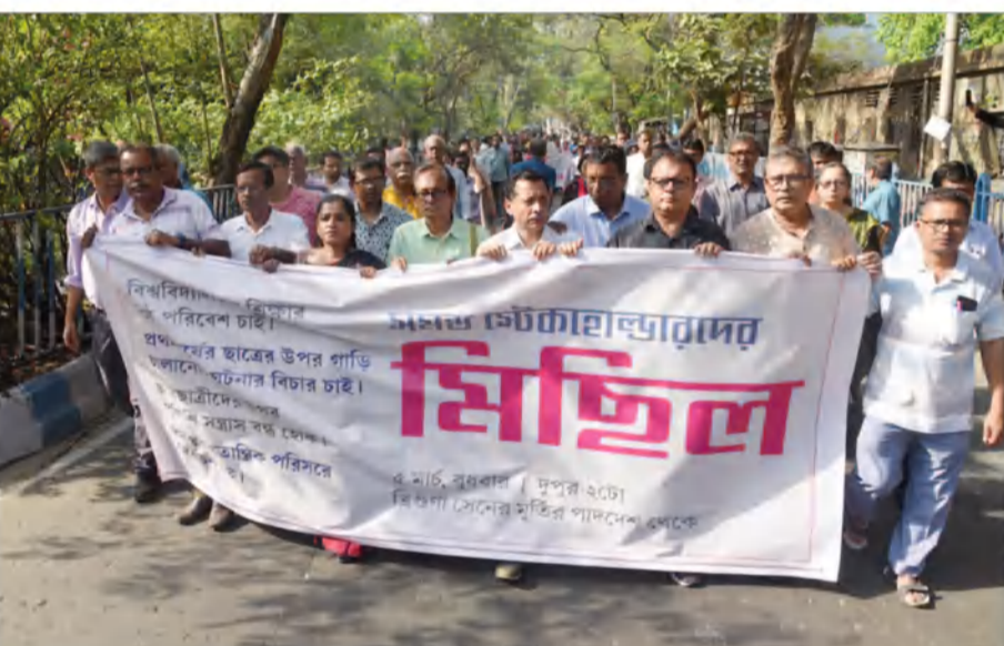
جاد پور یونیورسٹی کے تدریسی اور غیر تدریسی عملے نے کوکاکا میں یونیورسٹی کیس میں جاد پور یونیورسٹی واقعے کے خلاف احتجاجی ریلی میں حصہ لیا۔