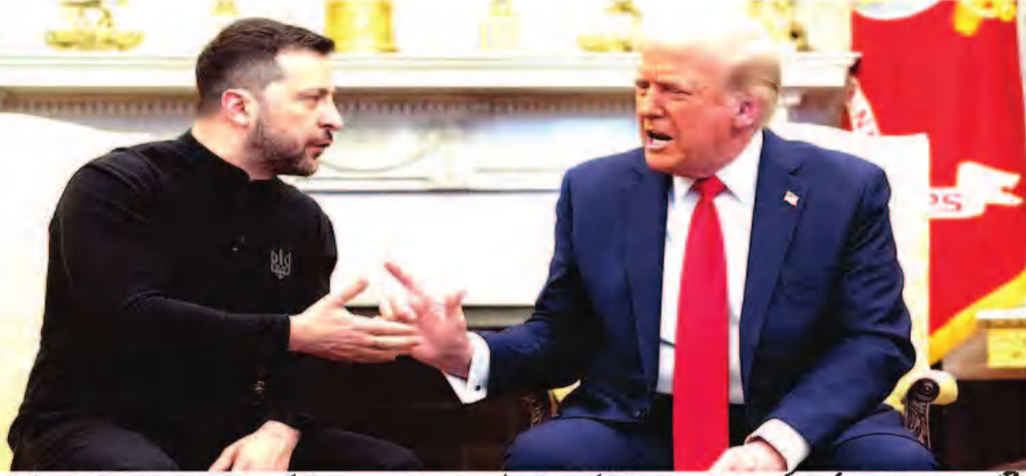
واشنگٹن، 5 مارچ (یو این آئی) امریکی صدر ڈونلڈ ٹرمپ نے کانگریس میں اپنے خطاب کے دوران کہا کہ مکمل کوزیلنسکی کے صدر ولودیمیر زیلنسکی سے ایک خط موصول ہوا جس میں اشارہ کیا گیا ہے

طرف سے ایک خط موصول ہوا۔ خط میں لکھا گیا ہے کہ "یوکرین پائیدار امن کے لیے جلد از جلد مذاکرات کی میز پر آنے کے لیے تیار ہے۔" یوکرین کے لوگوں سے زیادہ کوئی بھی امن نہیں چاہتا... میں اور میری ٹیم پائیدار امن کے حصول کے لیے صدر ٹرمپ کی مشہور قیادت میں کام کرنے کے لیے تیار ہیں۔" مسز زیلنسکی نے یوکرین کی مدد کے لیے واشنگٹن کی طرف سے کیے گئے اقدامات کی تعریف کی۔ مسز ٹرمپ نے خط کا حوالہ دیتے ہوئے کہا، "معدنیات اور سگورٹی کے معاملے سے سمجھوتے کے مسئلے میں یوکرین آپ کے لیے کبھی بھی وقت اس پر دیکھنا نہیں چاہتا۔" "مذاکرات کی میز پر آنے" کے لیے تیار ہے۔ مسز ٹرمپ نے کانگریس سے خطاب کے دوران کہا کہ "آج سے پہلے مجھے یوکرین کے صدر زیلنسکی کی