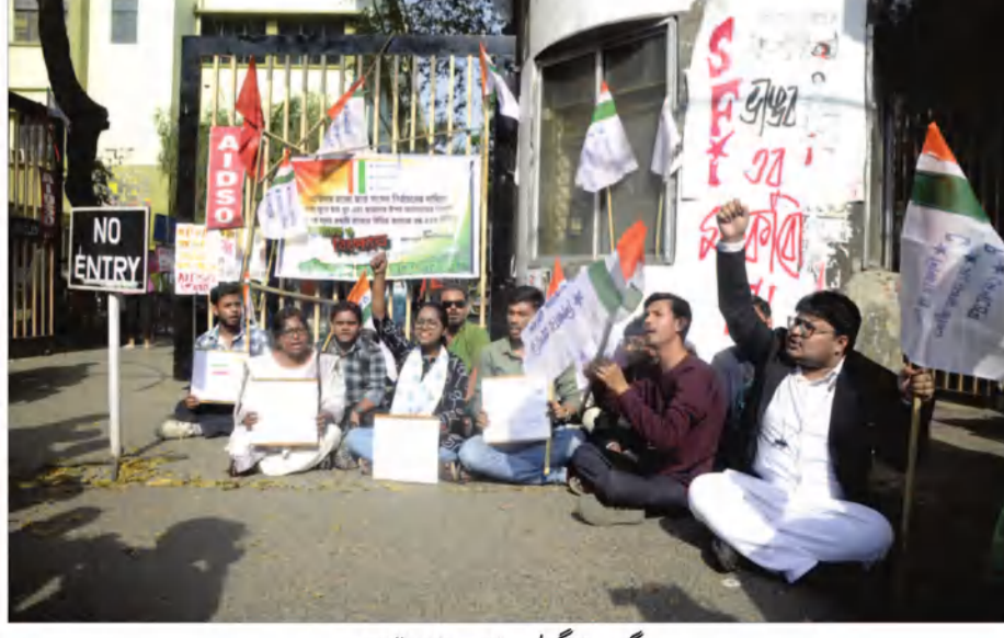
جوگیت پراگھریں چتر پراکھار کا احتجاج

کوکاکا، 5 مارچ: (عوامی نیوز سروس) کوکاکا کارپوریشن نے اسی گنگا کے کنارے سے غیر قانونی قابضین کو ہٹانے اور ان کی بحالی کا منصوبہ بنایا ہے۔ طویل عرصے سے اس علاقے میں رہنے والے لوگوں کو بے دخل کرنے کے بجائے ان کے لیے نئی رہائش گاہیں تعمیر کرنے کا فیصلہ کیا گیا ہے۔ اس فیصلے کو میونسپل آف میمز کے حالیہ اجلاس میں حتمی شکل دی گئی۔ کل 72 فلیٹوں پر مشتمل چار منزلہ ہاؤسنگ ایڈوکیٹ کالی گھاٹ اور خضر پور کے علاقوں میں بانگوار باری پر ویکٹ کے تحت بنائے جائیں گے۔ اس کے نتیجے میں کئی خاندانوں کو مستقل پتل چل جائیں گے۔ پروویکٹ کے مطابق کالی گھاٹ میں تلی نالہ کے کنارے پرستی شیکر بوں روکے ایک چار منزلہ عمارت تعمیر کی جائے گی۔ دوسری چار منزلہ عمارت تیرم بیج بازار کے سامنے رہنے والے مکینوں کی بحالی کے لیے چار منزلہ ہاؤسنگ ایڈوکیٹ بنائے جائیں گے، جن میں 64 فلیٹس ہوں گے۔ میونسپل کے ایک اہلکار نے کہا کہ یہ قدم انسانی ہمدردی کے نقطہ نظر سے اٹھایا گیا ہے، تاکہ ان خاندانوں کے رہائش کے حق کو یقینی بنایا جاسکے جو طویل عرصے سے وہاں رہ رہے ہیں۔ کوکاکا کارپوریشن ذرائع کے مطابق وہ اس مسئلہ پر تیزی سے کام شروع کرنا چاہتے ہیں۔ باز آباد کاری کے ساتھ ساتھ ای ڈی کو کالی گنگا کی خوبصورتی پر بھی زور دیا جا رہا ہے۔ تلی نالہ میں آبی آلودگی کو روکنے کے لیے 78 نالوں کے منہ بند کر کے انہیں سیوریج پمپنگ اسٹیشن اور سیوریج ٹریٹمنٹ پلانٹس سے منسلک کیا جا رہا ہے۔ آلودگی کی سطح بڑھ گئی ہے کیونکہ اس نالے کا گنداپانی سیدھا تلی نالہ میں گرتا ہے جس پر قابو پانے کے لیے بلدیہ اقدامات کر رہی ہے۔ تین مرحلوں میں گاد ہٹانے کا کام بھی زوروں پر ہے۔