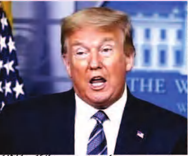
واشنگٹن، 5 مارچ (یو این آئی) امریکی صدر ڈونلڈ ٹرمپ کا کہنا ہے کہ جو ملک امریکہ پر ٹیرف لگائے گا اس پر جوابی ٹیرف لگائیں گے۔ ٹرمپ نے کانگریس کے سینیٹرز کے سامنے اپنے خطاب میں کہا کہ ہم نے امریکہ کو دنیا کا سب سے طاقتور ملک بنانے میں مدد کی ہے اور ہم اسے اس کی ذمہ داری اٹھانے کے لیے تیار ہیں۔

واشنگٹن، 5 مارچ (یو این آئی) امریکی صدر ڈونلڈ ٹرمپ نے کانگریس کے سینیٹرز کے سامنے اپنے خطاب میں کہا کہ ہم نے امریکہ کو دنیا کا سب سے طاقتور ملک بنانے میں مدد کی ہے اور ہم اسے اس کی ذمہ داری اٹھانے کے لیے تیار ہیں۔ ٹرمپ نے کہا کہ امریکہ نے دنیا کو امن اور خوشحالی کا راستہ دکھایا ہے اور وہ اسے اپنی ذمہ داری اٹھانے کے لیے تیار ہے۔