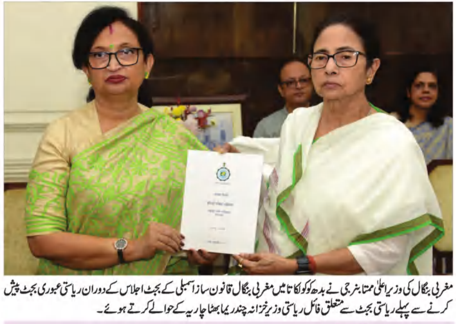
مغربی بنگال کی وزیر اعلیٰ ممتا بنرجی نے بدھ کوکولکاتا میں مغربی بنگال قانون ساز اسمبلی کے بجٹ اجلاس کے دوران ریاستی مخدومی بجٹ پیش کرنے سے پہلے ریاستی بجٹ سے متعلق فائل ریاستی وزیر خزانہ چندر بھما بھٹا جاسیہ کے حوالے کرتے ہوئے۔

الائٹس ملتا ہے۔ 20 لاکھ سے زائد خواتین نے بیوہ الائٹس حاصل کیا ہے۔ پورے ڈیم پروجیکٹ کے تحت 5.2 ملین سے زائد اسمارٹ فون فراہم کیے جائیں گے۔ ہم کسانوں اور کپڑے بھی مفت فراہم کرتے ہیں۔ اس سے 18 کروڑ طلبہ مستفید ہوں گے۔ 68 ہزار افراد کو زرعی پیش دی جا رہی ہے۔ ایم ایس ایم ای میں 13 ملین لوگ کام کر رہے ہیں۔ اپوزیشن بار بار تجارنی کانفرنس پر سوالات اٹھاتی ہے۔ اسی تناظر میں، ممتا نے آج کہا کہ اس سال کی