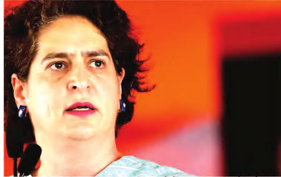
12 فروری: کانگریس کی رکن پارلیمنٹ پرینکا گاندھی نے نرملہ سیتارمن کی وزیر خزانہ نرملہ سیتارمن پر ان کے تبصرے کے لئے حملہ کیا کہ وزیر خزانہ پرینکا گاندھی کے دور میں ہندوستان میں مہنگائی یو پی اے حکومت کے

نے تشاہدی کی کہ یو پی اے کی زیر قیادت مرکزی حکومت کی دوسری مہاد کے دوران خوراک کی افراط زر "حیرت انگیز 11 فیصد" تھی۔ سیتارمن نے پھر کہا کہ اس کی ڈی اے حکومت کے تحت کھانے کی مہنگائی 2014 سے 2024 تک کم ہو کر 5.3 فیصد پر آگئی، انہوں نے مزید کہا کہ یو پی اے کے دور میں 10 فیصد کی دوہرے ہندسے والی مہنگائی اب "ایسا نہیں ہے"۔ کانگریس پر مزید حملہ کرتے ہوئے سیتارمن نے کہا کہ ہندوستان 2008 میں "پانچ کروڑ معیشتوں" میں شامل تھا۔ اس کے بعد اس نے کہا کہ ہندوستان پانچ تیز ترین معیشتوں میں شامل ہے۔ سیتارمن نے مزید کہا کہ ہندوستان میں بے روزگاری کی شرح 2017 میں 6 فیصد سے کم ہو کر 2024 میں 3 فیصد ہوگئی، جس نے مرکز کے روزگار میلہ "اقدام کو اجاگر کیا۔