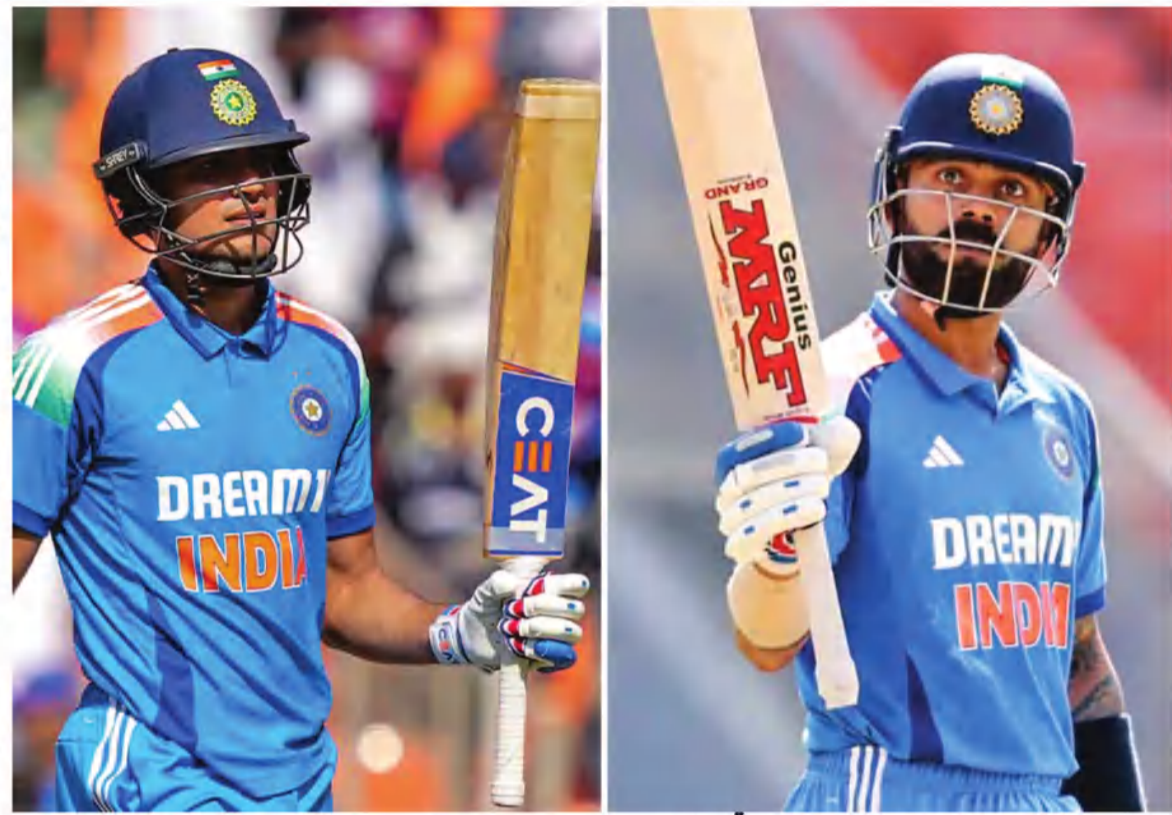
احمد آباد، 12 فروری (یو این آئی): انڈیا نے 142 رنوں سے انگلینڈ کو تیسرے ون ڈے میں شکست فاش دیدی اور تین میچوں کی سیریز 0-3 سے قبضہ کر کے انگلینڈ کا برڈان واٹس مکمل کر دیا۔

بچانے میں کامیاب رہے۔ انہیں عادل راشد (64 رن پر چار وکٹ) نے ایک بار پھر اپنا شکار بنایا۔ پاکستان یوونت شرما صرف ایک رن ہی بنا سکے۔ دوسری طرف ٹیم کے گل نے انگلینڈ کے حملے کی دھجیاں اڑا دیں۔ انہوں نے اپنے ایک روزہ کیریئر کی ساتویں سنچری صرف 95 گیندوں پر مکمل کی۔ وہ نریندر مودی اسٹیڈیم میں کرکٹ کے تینوں فارمیٹس میں سنچری بنانے والے اگلوتے ہندوستانی کھلاڑی بن گئے ہیں۔ راشد کا شکار بننے سے پہلے انہوں نے اپنی سنچری کی انگلینڈ میں 14 چوکے اور تین چھکے مارے۔ کوہلی کے آؤٹ ہونے کے بعد دوسرے سرے پر آ کر کھڑے ہوئے شریں ایسٹری نے گل کا بھرپور ساتھ دیا اور صرف 64 گیندوں کی انگلینڈ میں آٹھ چوکے اور دو چھکے لگائے۔ وہ بھی عادل راشد کی گیند پر وکٹ کے پیچھے بچ گئے۔ کے ایل راہل (40) نے جارحانہ بیٹنگ کا مظاہرہ کرتے ہوئے انگلش باؤلرز کی خوب دھلائی کی، تاہم ان کی 29 گیندوں کی مختصر انگلینڈ کا خاتمہ ثابت ہو جانے لگا۔ بعد میں دن اوسط بڑھانے کی کوشش میں ہندوستانی کھلاڑی ایک کے بعد ایک اپنی وٹیں گناتے رہے اور پوری انگلینڈ 50 ویں اور ویں آخری گیند پر سٹ گئی۔ انگلینڈ کی طرف سے عادل سب سے کامیاب گیند باز رہے جبکہ مارک ووڈ نے دو ہندوستانی کھلاڑیوں کو پولیٹین کا راستہ دکھایا۔ گس بٹلنگس، جو روٹ اور فائنل ون ڈے میں ایک ایک وکٹ ملی۔