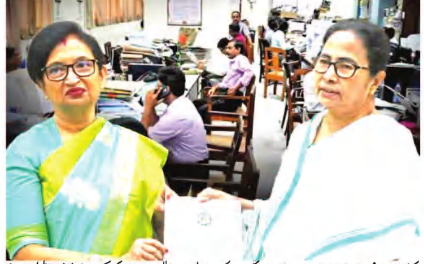
کولکاتا: 12 فروری (عوامی نیوز سروس) جو امیدی، اس کو پورا کرتے ہوئے، ریاست کی وزیر مملکت برائے خزانہ چندر میمانے نے بدھ کو اپنی بجٹ تقریر میں سرکاری ملازمین کے لیے چار فیصد مہنگائی (DA) کا اعلان کیا۔ اس کے نتیجے میں بدھ کو 18 فیصد ہو گیا۔ چندر میمانے نے کہا کہ توسیع شدہ ڈی اے کی اپریل سے لاگو ہوگا۔ اس سال بجٹ 2026 کے اسمبلی انتخابات سے پہلے وزیر اعلیٰ ممتا بنرجی کی حکومت کا آخری مہل بجٹ ہے۔ اس لیے ریاستی سرکاری ملازمین اس بجٹ میں مہنگائی (DA) کی ایک بڑی رقم کا اعلان کرنے کی امید کر رہے تھے۔ ان کا حساب یہ تھا کہ وزیر اعلیٰ آئندہ بجٹ میں اسمبلی انتخابات کو مد نظر رکھتے ہوئے کئی نئے منصوبوں کا اعلان کر سکتے ہیں۔ اس کے علاوہ روپاشری، کنیا مشری، اور لکشمی چندر میمانے کے لیے اضافی فنڈز مختص کیے جاسکتے ہیں۔ اس کی بنیاد پر، سرکاری ملازمین کا خیال ہے کہ حکومت ان کا حق جیتنے کے لیے بجٹ میں ڈی اے کی ایک بڑی رقم کا اعلان کر سکتی ہے۔

کولکاتا: 12 فروری (عوامی نیوز سروس) جو امیدی، اس کو پورا کرتے ہوئے، ریاست کی وزیر مملکت برائے خزانہ چندر میمانے نے بدھ کو اپنی بجٹ تقریر میں سرکاری ملازمین کے لیے چار فیصد مہنگائی (DA) کا اعلان کیا۔ اس کے نتیجے میں بدھ کو 18 فیصد ہو گیا۔ چندر میمانے نے کہا کہ توسیع شدہ ڈی اے کی اپریل سے لاگو ہوگا۔ اس سال بجٹ 2026 کے اسمبلی انتخابات سے پہلے وزیر اعلیٰ ممتا بنرجی کی حکومت کا آخری مہل بجٹ ہے۔ اس لیے ریاستی سرکاری ملازمین اس بجٹ میں مہنگائی (DA) کی ایک بڑی رقم کا اعلان کرنے کی امید کر رہے تھے۔ ان کا حساب یہ تھا کہ وزیر اعلیٰ آئندہ بجٹ میں اسمبلی انتخابات کو مد نظر رکھتے ہوئے کئی نئے منصوبوں کا اعلان کر سکتے ہیں۔ اس کے علاوہ روپاشری، کنیا مشری، اور لکشمی چندر میمانے کے لیے اضافی فنڈز مختص کیے جاسکتے ہیں۔ اس کی بنیاد پر، سرکاری ملازمین کا خیال ہے کہ حکومت ان کا حق جیتنے کے لیے بجٹ میں ڈی اے کی ایک بڑی رقم کا اعلان کر سکتی ہے۔ وزیر اعظم نریندر مودی کی حکومت نے حال ہی میں مرکزی حکومت کے ملازمین کے لیے آٹھویں تنخواہ کمیشن کے اعلان کے بعد مرکزی حکومت کے ملازمین اور مغربی بنگال کے ریاستی سرکاری ملازمین کی تنخواہوں اور ڈی اے کے درمیان فرق نمایاں طور پر بڑھنے والا ہے۔ اس سے ریاستی سرکاری ملازمین کی تنخواہوں کے مطالبات کو مزید تقویت ملی، جو ڈی اے کو لے کر طویل عرصے سے احتجاج کر رہی ہیں۔ سرکاری ملازمین ووٹ ڈالنے میں اہم کردار ادا کرتے ہیں۔ اس لیے انتظامیہ کے ایک طبقے کو لگتا ہے کہ ریاستی حکومت کو ریاستی بجٹ میں ان کے لیے کچھ اضافی کے بارے میں سوچنا چاہیے۔