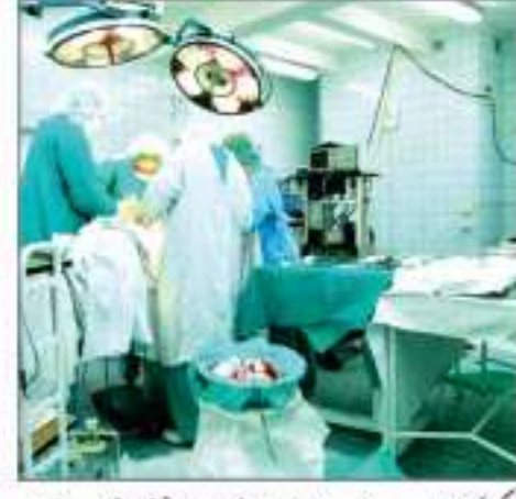
کولکاتا، 22 جنوری: (عوامی نیوز) سروں) اسپتال میں سرجری کے دوران لاپرواہی کا الزام لگا ہے۔ ٹیویئر مریض کے سینے کے اندر رہ گیا۔ بعد میں ایس ایس کے ایم اسپتال میں دوبارہ سرجری کی گئی اور ٹیویئر نکال دیا گیا۔ اس واقعے میں ریاستی صحت کمیشن نے مریض کے اہل خانہ کو 5 لاکھ روپے معاوضہ ادا کرنے کا حکم دیا ہے۔ حکام کو یہ معاوضہ ادا کرنا پڑے گا۔ واضح رہے کہ ہیلتھ کمیشن کے چیئرمین ایم۔ کمار بھرنی نے کہا کہ اسپتال کی لاپرواہی سے متعلق شکایات گزشتہ سال اگست میں درج کی گئی تھیں۔ اسی مناسبت سے ہیلتھ کمیشن میں 29 اگست کو پہلی سماعت ہوئی۔ مریض نے شکایت کی کہ میڈیکا میں سرجری کے بعد اسے سینے میں تکلیف ہے۔ اگرچہ اسپتال کو اس کے بارے میں مطلع کیا گیا تھا، لیکن حکام نے اسے اس کی شکایت پر توجہ نہیں دی۔ بعد میں مریض کے سینے کے ایکسرے سے معلوم ہوا کہ ایک سسٹ باقی ہے۔ میڈیکل ٹیم نے اس کے بعد بھی حکام سے تعاون نہیں کیا۔ مریض نے شکایت کی کہ اسپتال نے اسے مطلع کیا کہ ٹیویئر مریض کے سینے میں ہے۔ لیکن مریض کے لوگوں کو اس کا خریچہ برداشت کرنا پڑا۔ انہیں یہ بھی مطلع کیا گیا کہ اس معاملے میں کوئی صحت کی دیکھ بھال یا کوئی میڈی کلیم فوائڈ دستیاب نہیں ہوئی۔

کولکاتا، 22 جنوری: (عوامی نیوز) سروں) اسپتال میں سرجری کے دوران لاپرواہی کا الزام، پانچ لاکھ کا جرمانہ۔ اسپتال کی غفلت کے باعث پیدا ہوئی ہے۔ اس لیے اعلیٰ سرجری مفت ہونی چاہیے۔ اس کے بعد وہ ایس ایس کے ایم اسپتال گئے اور وہاں ان کی سرجری ہوئی۔ مریض فی الحال صحت مند ہے۔ اسپتال نے کہا کہ اس واقعے میں ہم نے میڈیکا سے معاوضے کے طور پر پانچ لاکھ روپے ادا کرنے کو کہا ہے۔ ایسی غلطیاں ضرور ہوتی ہیں۔ کیونکہ سب انسان ہیں۔ لیکن ڈاکٹروں کو زیادہ متاثر رہنا چاہیے۔ مریض کے اہل خانہ نے ایک کروڑ روپے کے معاوضے کا مطالبہ کیا۔ لیکن اسپتال نے اس دعوے کو مقبول نہیں سمجھا۔ میڈیکا کو 29 اگست اور 29 نومبر کو دودن کی ساعت کے بعد جرمانہ ادا کرنے کو کہا۔ جب میڈیکا حکام سے رابطہ کیا گیا تو ان کا کہنا تھا کہ انہوں نے سنا ہے کہ ایسا کوئی حکم جاری کیا گیا ہے۔ لیکن ہدایات کی کاپی نہیں ملی۔ اسپتال کے حکام پر متعلقہ دستاویزات کو دیکھنے کے بعد اس پر تہرہ کریں گے۔