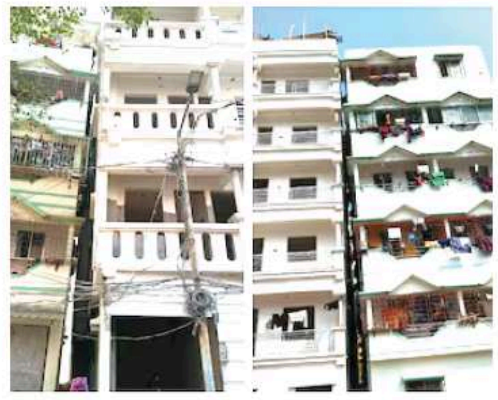
کولکاتا، 22 جنوری: (عوامی نیوز) سروں) کاٹینگر میں ایک کثیرالمنزلہ عمارت جھکی گئی۔ کولکاتا میونسپل کارپوریشن نے کثیرالمنزلہ عمارت کو منہدم کرنے کا حکم دیا ہے۔

کولکاتا، 22 جنوری: (عوامی نیوز) سروں) کاٹینگر میں ایک کثیرالمنزلہ عمارت جھکی گئی۔ کولکاتا میونسپل کارپوریشن نے کثیرالمنزلہ عمارت کو منہدم کرنے کا حکم دیا ہے۔ بتایا گیا ہے کہ مسابری کا کام جلد شروع کیا جائے۔ میونسپل میئر کونسل کے علاقے میں کثیرالمنزلہ عمارت سے بے چین ہے۔ اس لیے فوری کارروائی کی جا رہی ہے۔ تھانہ ٹینگر نے پہلے ہی علاقے میں مائیکنگ شروع کر دی ہے۔ میونسپل کا حکم آنے کے بعد ٹینگر پولس اسٹیشن نے دو کثیرالمنزلہ عمارتوں کے کینوں کو وہاں سے نکل جانے کو کہا ہے۔ پولس ایگرنے کہا کہ اس کثیرالمنزلہ عمارت کو گرانے کا کام جمعرات سے شروع ہوگا۔ ہم آپ سے علاقہ خالی کرنے کی درخواست کرتے ہیں۔ واضح رہے کہ ٹینگر میں کرسٹوفر روڈ پر تعمیر ہونے والا کثیرالمنزلہ عمارت ایک طرف جھکی ہوئی ہے۔ کولکاتا، 22 جنوری: (عوامی نیوز) سروں) کاٹینگر میں ایک کثیرالمنزلہ عمارت جھکی گئی۔ کولکاتا میونسپل کارپوریشن نے کثیرالمنزلہ عمارت کو منہدم کرنے کا حکم دیا ہے۔ بتایا گیا ہے کہ مسابری کا کام جلد شروع کیا جائے۔ میونسپل میئر کونسل کے علاقے میں کثیرالمنزلہ عمارت سے بے چین ہے۔ اس لیے فوری کارروائی کی جا رہی ہے۔ تھانہ ٹینگر نے پہلے ہی علاقے میں مائیکنگ شروع کر دی ہے۔ میونسپل کا حکم آنے کے بعد ٹینگر پولس اسٹیشن نے دو کثیرالمنزلہ عمارتوں کے کینوں کو وہاں سے نکل جانے کو کہا ہے۔ پولس ایگرنے کہا کہ اس کثیرالمنزلہ عمارت کو گرانے کا کام جمعرات سے شروع ہوگا۔ ہم آپ سے علاقہ خالی کرنے کی درخواست کرتے ہیں۔ واضح رہے کہ ٹینگر میں کرسٹوفر روڈ پر تعمیر ہونے والا کثیرالمنزلہ عمارت ایک طرف جھکی ہوئی ہے۔