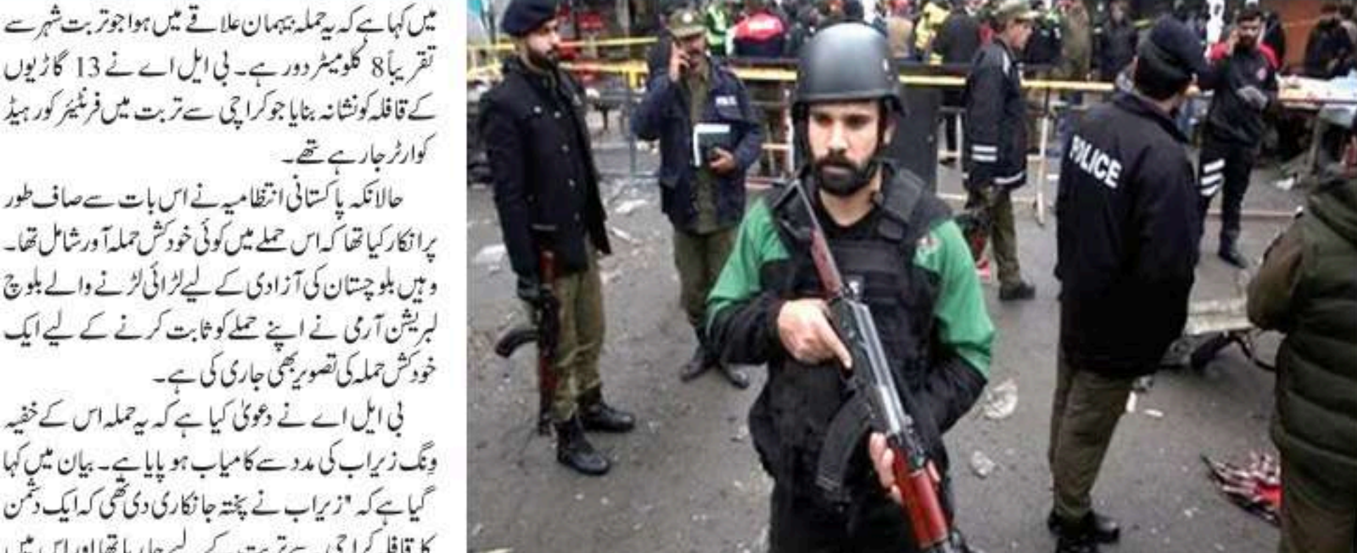
6 جنوری: گزشتہ روز پاکستان میں بلوچ لبریشن آرمی (بی ایل اے) نے بڑے حملے کو انجام دیا۔ اس تنظیم کی فدائی یونٹ نے بلوچستان کے تربت کے پاس پاکستانی فوجی قافلہ پر حملہ کر دیا جس میں 47 پاکستانی فوجیوں کی ہلاک ہونے کی خبر ہے۔ حملے میں 30 افراد زخمی بھی ہوئے ہیں۔ بی ایل اے کے تربت میں زید بلوچ نے ایک بیان میں بلوچ قوم (باقی صفحہ 3 پر)