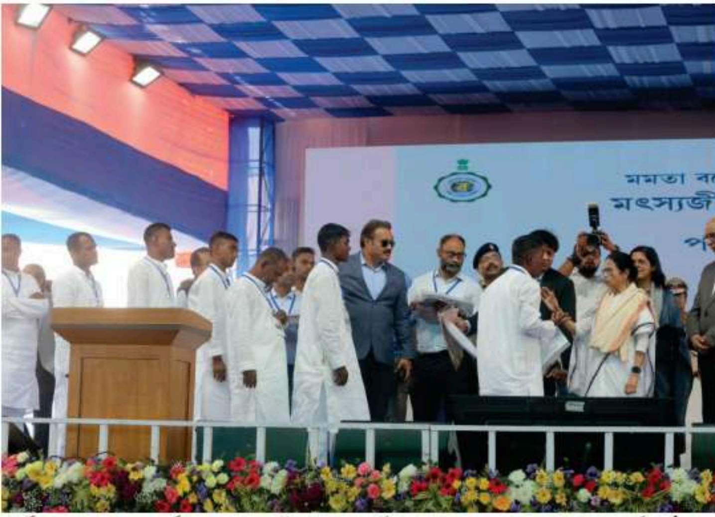
ہندوستانی ماہی گیری جوبنگلہ دیش میں قید میں تھے وہ ممتاز مہاجر کی ایما پر رہا کئے گئے جو ان سے ملنے کیلئے آئے اور منتانے ان کیلئے امداد اور سمندروں میں نگرانی کا حکم دیا۔

Page-12 • 07 • شمارہ: 12 • جلد: 12 • KOLKATA • Tuesday 7th January, 2025 • RNI No. WBURD/2014/56804 • E-mail: News: aawaminews@gmail.com, Adv: kolkataadv@gmail.com, Ph: 033-46034477 / 40651166, Fax: 033-4662-8332 • 6 رجب المرجب 1446ھ • منگل، 7 جنوری 2025ء • کلکتہ