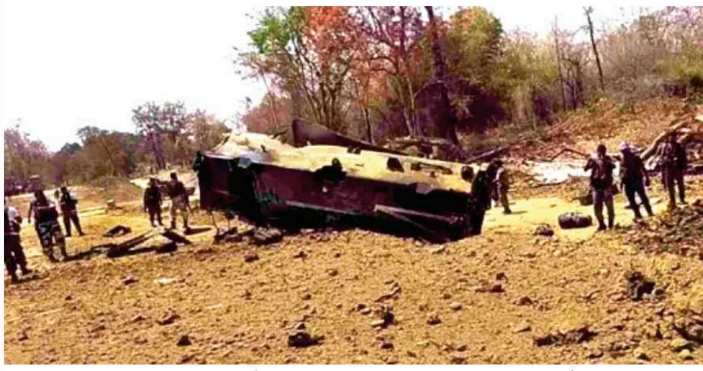
6 جنوری: چھتیس گڑھ کے بیجاپور میں نکسلویوں نے ایک بڑا حملہ کیا ہے جس میں کئی جوان شہید ہو گئے۔ آئی ای ڈی سے بیکورنی فورسز کی ایک گاڑی کو روپوش میں بتایا جا رہا ہے کہ نکسلویوں نے کئی گاڑیوں پر آئی ای ڈی پلانٹ کیا تھا جس کی زد میں بیکورنی کی شہادت کی خبریں سامنے آ رہی (باقی صفحہ 3 پر)