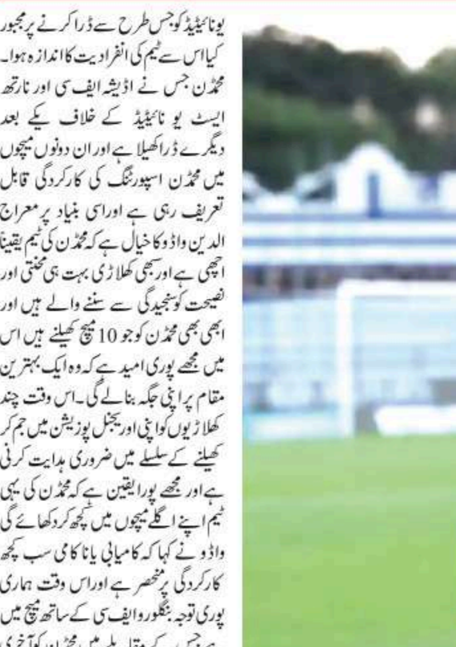
کولکاتا 6 جنوری: محمد ن اسپورٹنگ کے معادن کوچ معراج الدین واڈو نے ٹیم کے کھلاڑیوں کی تعریف کی جنہوں نے زبردست فارم رکھنے والی ٹیم تیار کی ہے۔

کیپ ٹاؤن ٹیسٹ کے چوتھے روز پاکستان نے 3 وکٹوں کے نقصان پر 64 رنز سے اننگز کا آغاز کیا تھا ہم پاکستان کی پوری ٹیم جنوبی افریقا کے خلاف 194 رنز پر آؤٹ ہو کر فالو ان کا شکار ہو گئی۔ 421 رنز خسارے کے ساتھ پاکستان کی دوسری بیٹنگ شروع ہوئی، باہر اعظم 81 رنز بنا کر آؤٹ ہو گئے، پاکستان نے تیسرے روز کے اختتام تک ایک وکٹ کے نقصان پر 213 رنز بنائے۔ شان مسعود 102 اور محمد شہزاد 8 رنز کے ساتھ کرپرز پر موجود تھے۔ قبل ازیں پہلی اننگز میں کپتان محمد رضوان اور باہر اعظم نے ذمہ دارانہ بیٹنگ کا مظاہرہ کرتے ہوئے 98 رنز کی پانچویں رقم قائم کی۔